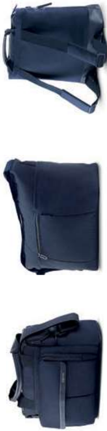
Borse Scopri i modelli e i colori a pagina 100 Biggs Discover the colour range on page 100