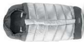
Sacco invernale Passeggino Scopri tutte le varianti a pagina 108 Snuggler Winter Muff Discover the colour range on page 108