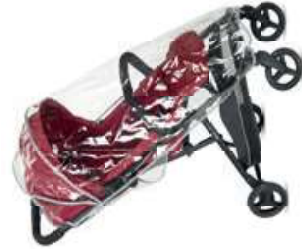
Parapiovia per Storch Rain Cover for Storch