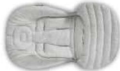
Baby Snugg Pad - Cuscino Riduttore per Passeggino Baby Snugg Pad - Snuggler Adapter