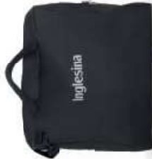
Borsa porta passeggino Snuggler carry bag